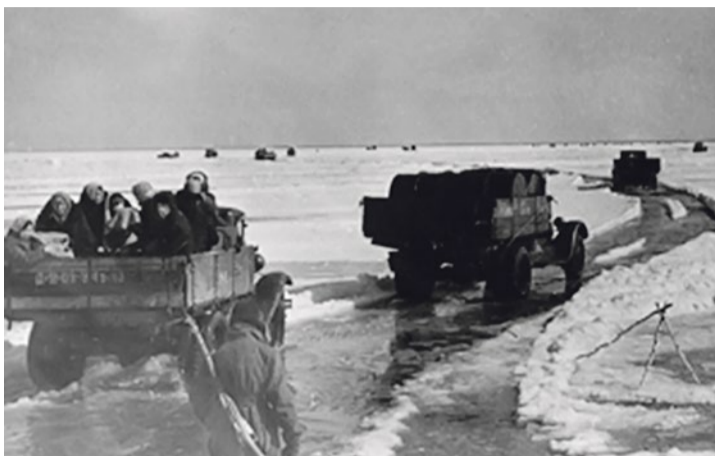
На Дороге жизни