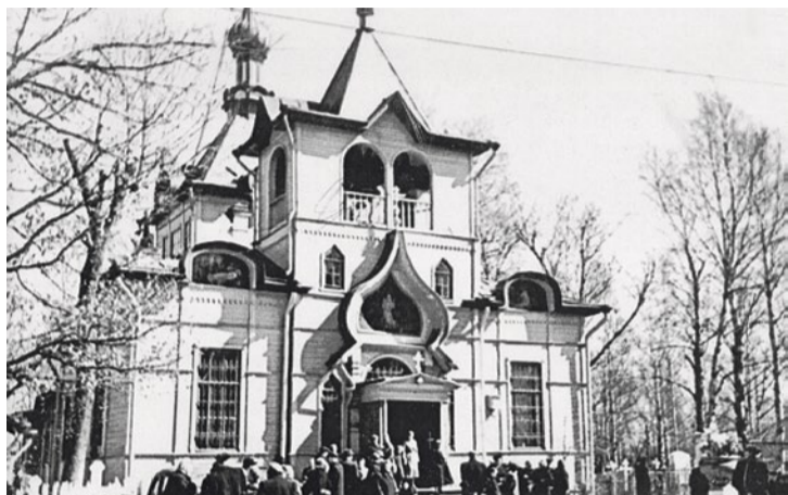
Храм Серафима Саровского в годы блокады

Вновь предлагаем читателям отправиться в путешествие по прошлым столетиям и вспомнить о событиях, которые происходили на территории современного Приморского района в зимние месяцы разных лет.