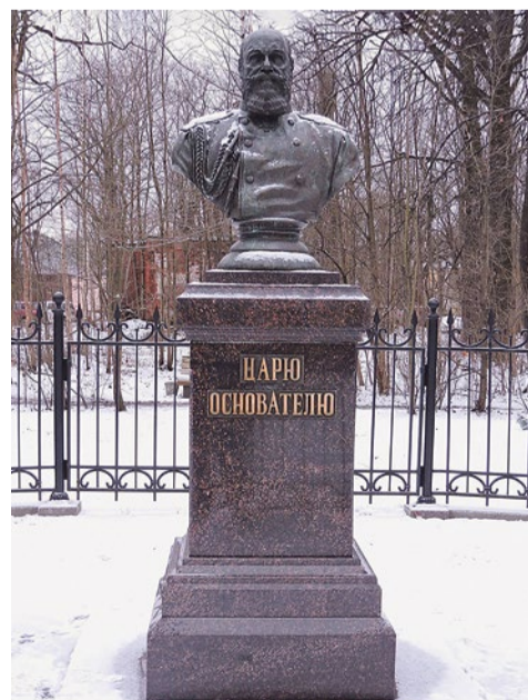
Восстановленный памятник, 2016 г.