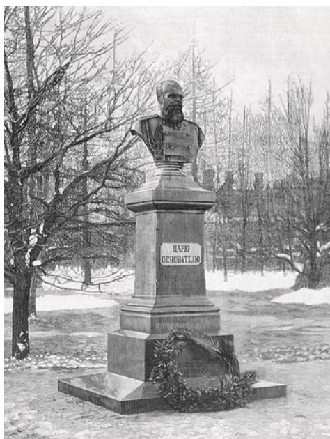
Памятник Александру III, 1895 г.

27 января 1944 года в День ленинградской победы зазвонили церковные колокола и звонили весь день, несмотря на действующий в то время запрет на колокольный звон. А 27 января 1965 года на месте 16 братских могил на Серафимовском кладбище торжественно открыли мемориал «Жертвам блокадного Ленинграда».